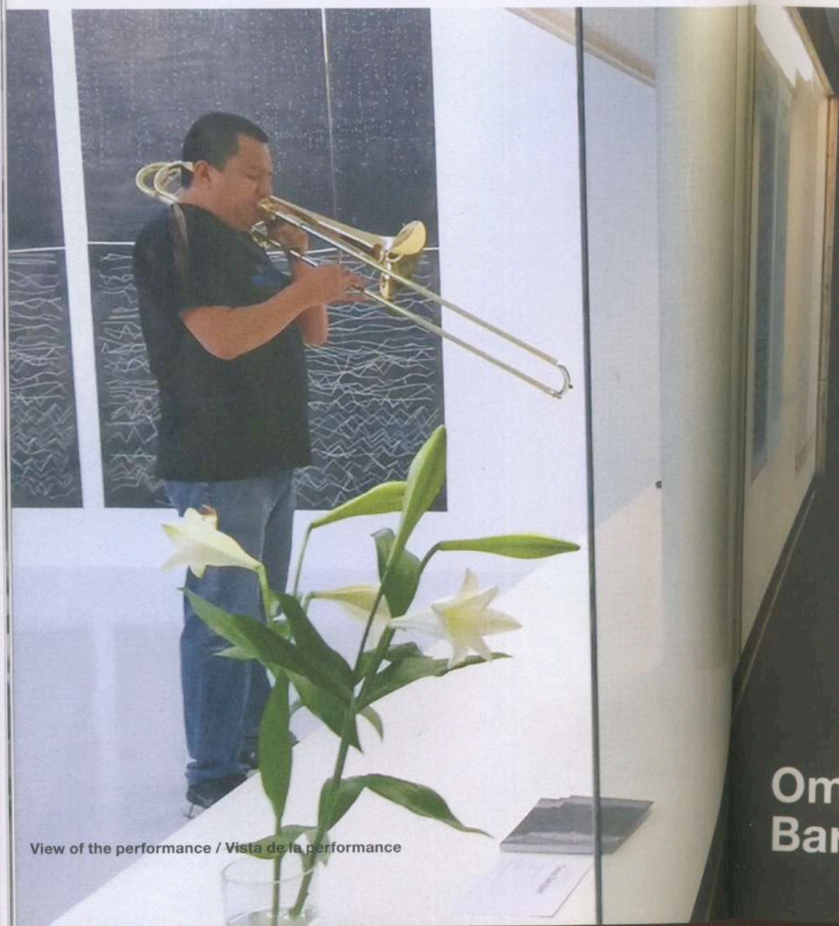
View of the performance / Vista de la performance